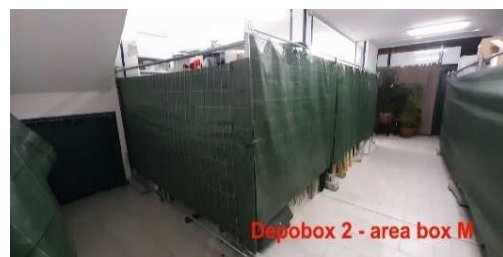
AREA BOX PRIVATO Medium

Misure: lung. 3,30 lar. 1,80 al. 3,00 m.quadri 6 / m.cubi 18,00