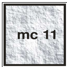
BOX ACCIAIO MEDIUM vuoto 1/3 M

Misure: lung 2,00 lar 2,34 al. 2,39 m.quadri 4,65 / m.cubi 11,00