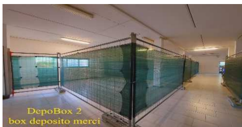
AREA BOX PRIVATO Large

Misure: lung. 5,20 lar. 2,10 al. 3,00 m.quadri 10 / m.cubi 30