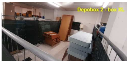
AREA BOX PRIVATO Xlarge

via Caduti sul Lavoro 18 - z.i. San Pietro in Palazzi - Cecina Li